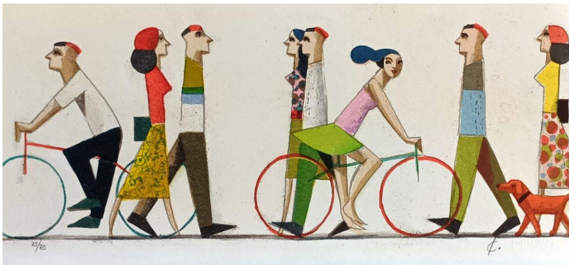
Les passants III . Didier Lourenço, 2023.